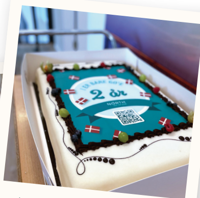
Vi fejrede 2 års fødselsdag